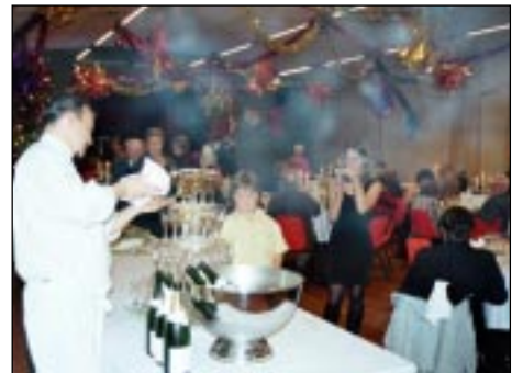
Remplies avec délicatesse, ces flûtes de Champagne ont toutes trouvé preneur.